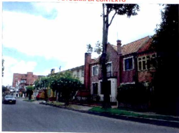
CRITERIOS DE CALIFICACION